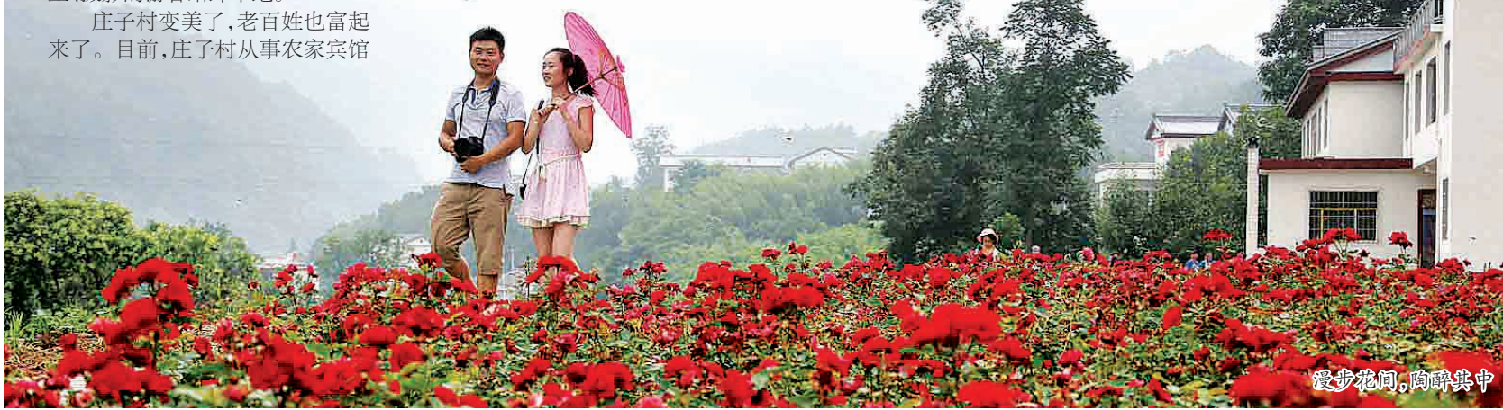
漫步花间,陶醉其中

经营的已有116家,从事旅游业的村民占全村居民的50%。2013年旅游接待高峰期,床位入住率在95%以上,全年接待的游客人数比2012年增长200%。 庄子村广阔的乡村旅游发展前景,吸引了不少投资商关注。目前,已有怡景园生态度假山庄、安缦山寨田园酒店群落等旅游地产项目落户庄子村,项目投资额均超1亿元。其中,怡景园项目一期已于今年3月开工,预计10月底完工;安缦山寨项目将于今年7月开工,2015年7月完工。 群山竞秀,鲜花绽放,莺飞蝶舞,如今的庄子村已成为国家乡村旅游的示范村,成为“全景栾川”建设的乡村典范。