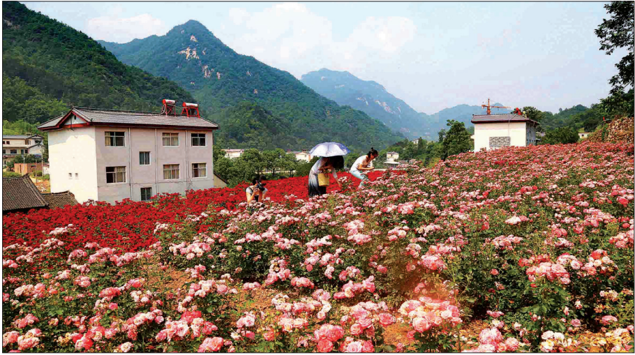
青山、绿树、鲜花,庄子村——一个迷人的地方