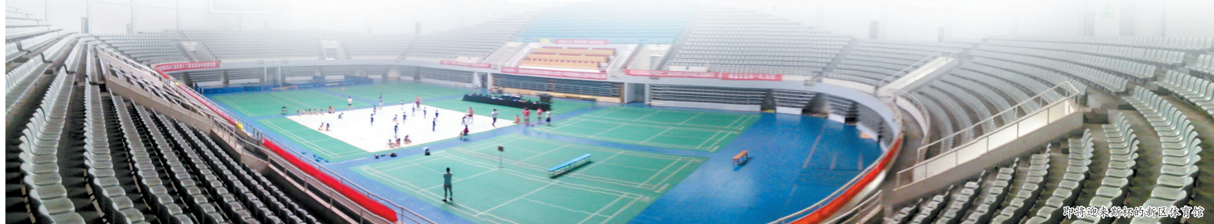
即将迎来斯杯的新区体育馆

一体化。深圳地铁网络、大运中心等重要设施及其配套工程的建设,改变了原特区外宝安、龙岗两区相对落后的面貌,使原特区外基础设施和环境建设迅速跃升。深圳大运会共使用63个体育场馆,其中新建的22个场馆有一半以上布局在原特区外地区,加快了特区一体化进程,改善原特区外地区的公共福利事业。龙岗区还新建了一个占地49.2万平方米的大运村,赛后作为深圳职业技术学院新校区的重要组成部分。(郝洋)