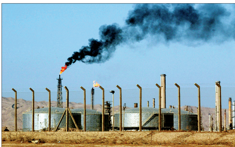
伊拉克萨马拉赫丁省警方人士6月18日说,反政府武装当天早上开始对位于该省拜伊吉市的伊最大炼油厂发起进攻。

伊拉克安全部队17日与反政府武装继续在东、西、北三线展开争夺战。上周,两大重要城市摩苏尔和提克里特相继沦陷后,伊拉克安全局势迅速恶化。