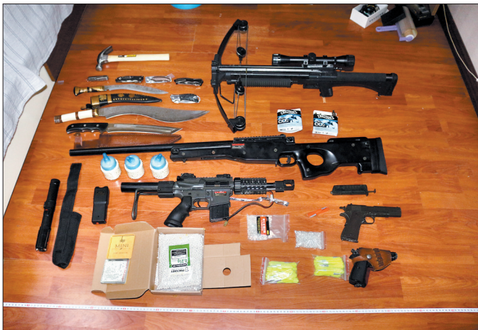
警方缴获的防真枪支、刀具等