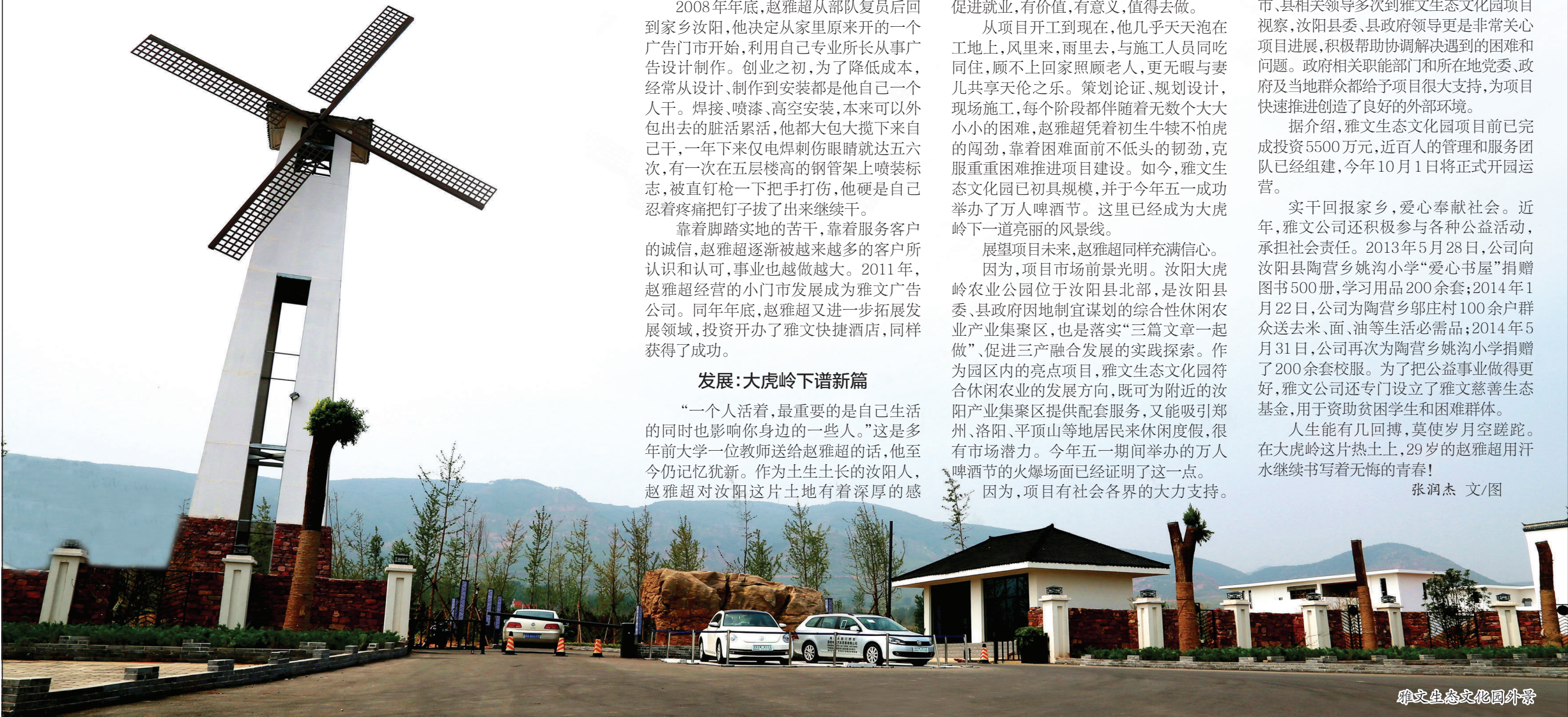
雅文生态文化园外景