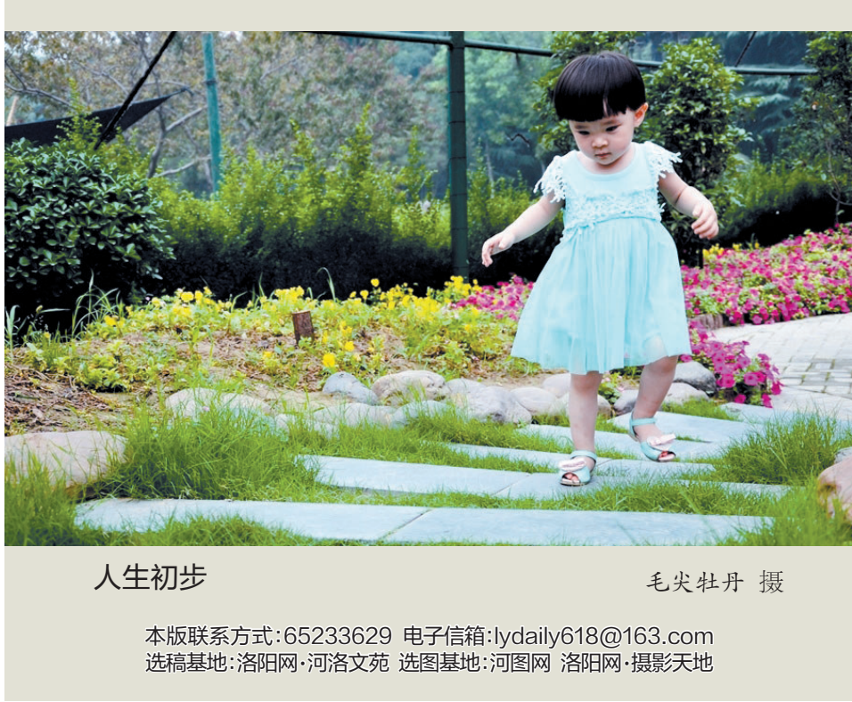
人生初歩

真的是爱上了苦瓜了！爱上了它的口味，也爱上了它的外形，绿莹莹的，冰清玉洁。我也像母亲一样，在瓜架前，小心翼翼地摘下苦瓜，握在手里，轻声说：“苦瓜可是好东西呢！”那种感觉，真有点“采菊东篱下”的悠然和淡然。