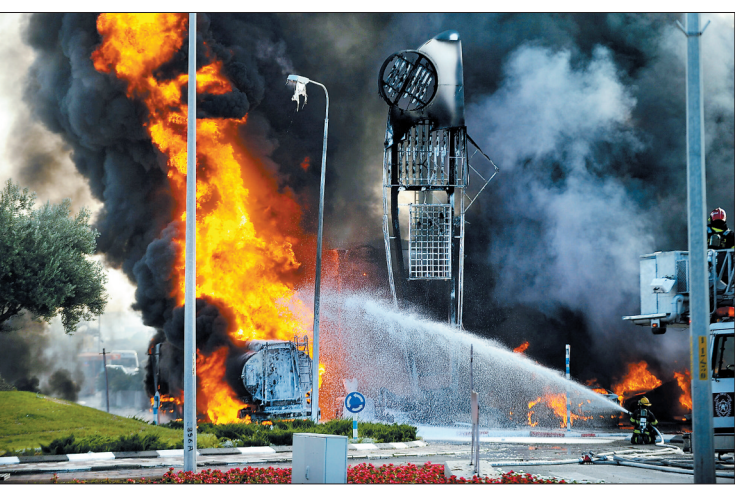
以南部城市阿什杜德一家加油站遭到火箭弹袭击后起火

军给出的解释是,这些遭轰炸的加沙地带民房已经被“军用”,“储藏武器或用作指挥中心,抑或联络点”。