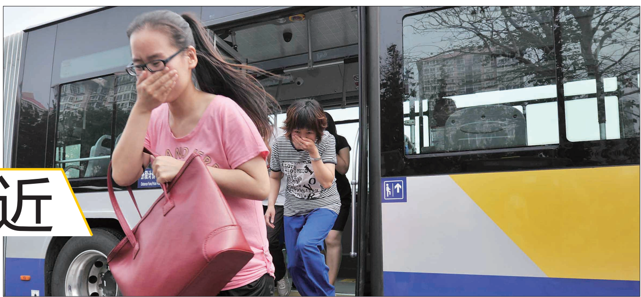
16日,北京市开展公交车反恐防暴演练,乘客从一辆“着火”的公交车上疏散