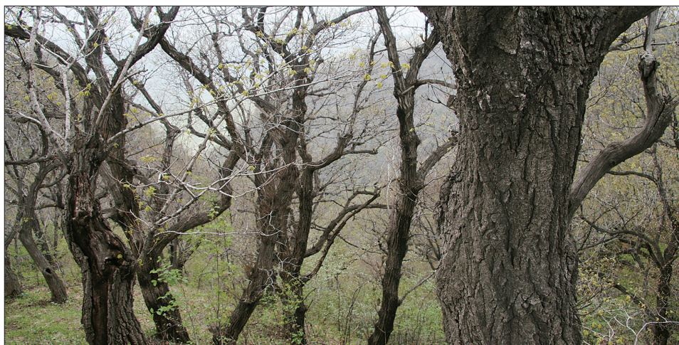
王坪乡境内茂密的原始森林

焦山北边的逍遥谷,则是另一番景色。这里溪流清澈、林木茂密,大小几十处瀑布分级顺势而下,令人目不暇接。由最大的一处瀑布冲击而成的水潭被称为仙女池,民间有