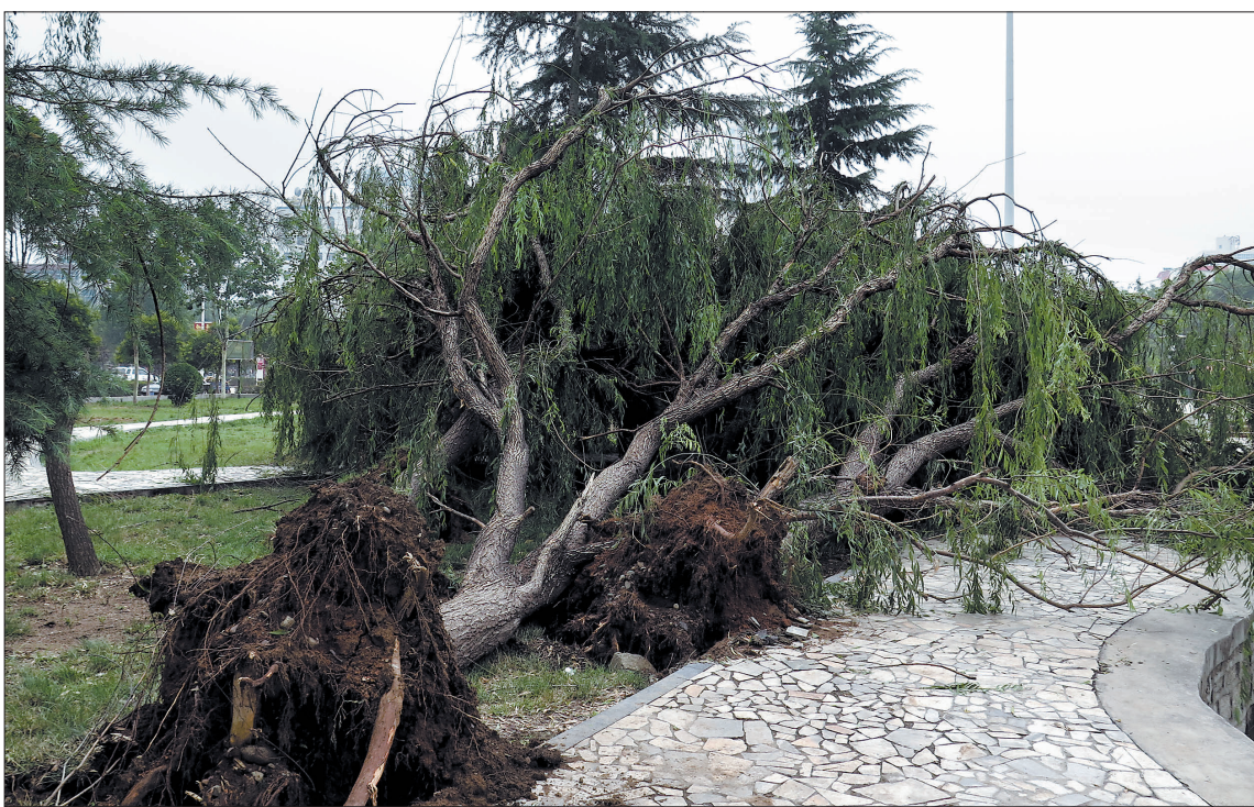
树被连根拔起