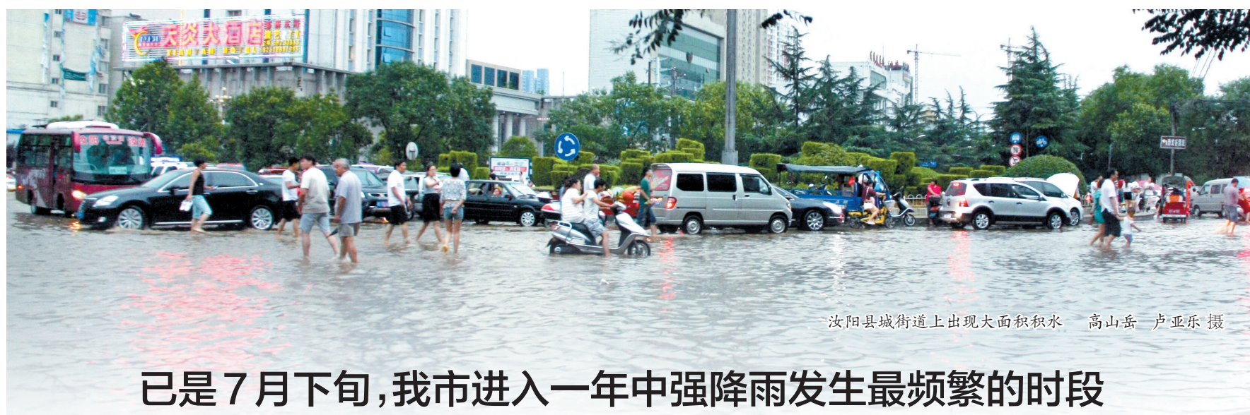
汝阳县城街道上出现大面积积水