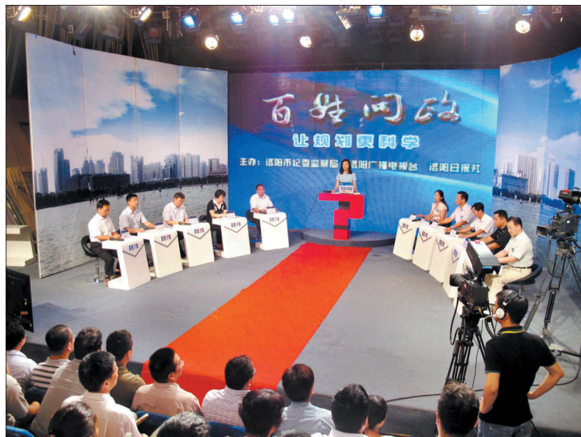
《百姓问政》节目第四场直播现场

虽然目前我市实现了户外广告事前联合审批,但在后期管理上也确实有责任不明确的情况。下一步,我们将进一步明确责任,加强管理,并在电子屏户外广告的审批上更加慎重。