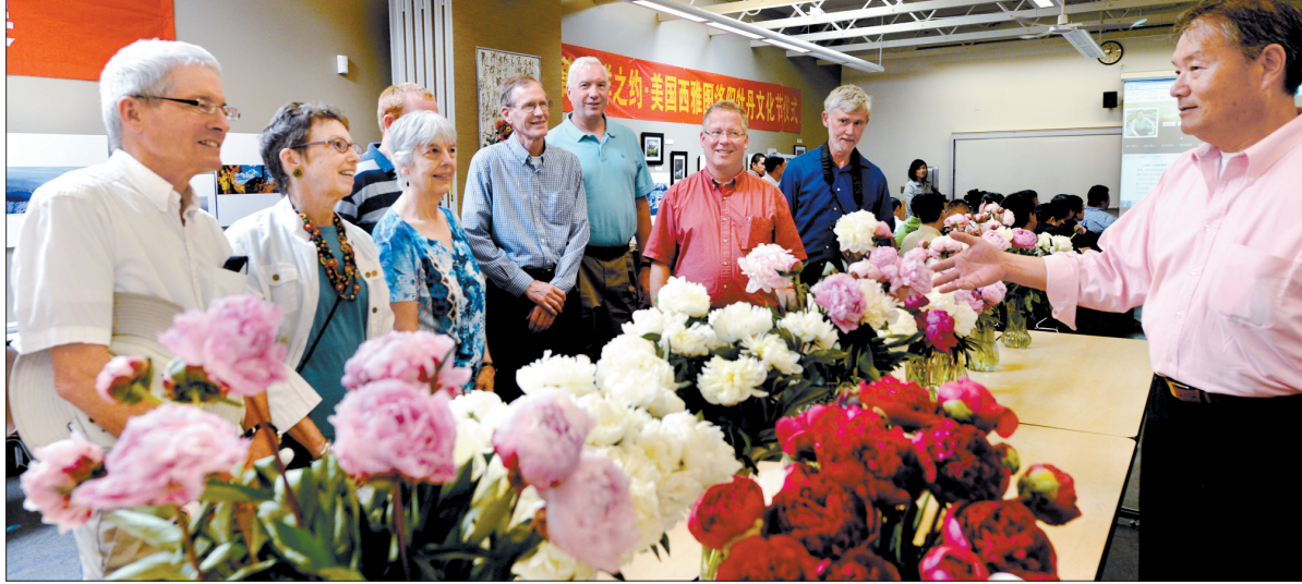
牡丹插花展吸引了众多西雅图市民观赏

当地时间27日上午,在美国西雅图市西华园,美国西雅图洛阳牡丹文化节开幕式隆重举行,西雅图洛阳牡丹插花展和西雅图-洛阳经贸洽谈会同时开幕。当日下午,在美国西雅图长城购物中心,洛阳牡丹花都特产专卖美国西雅图店揭牌仪式隆重举行。