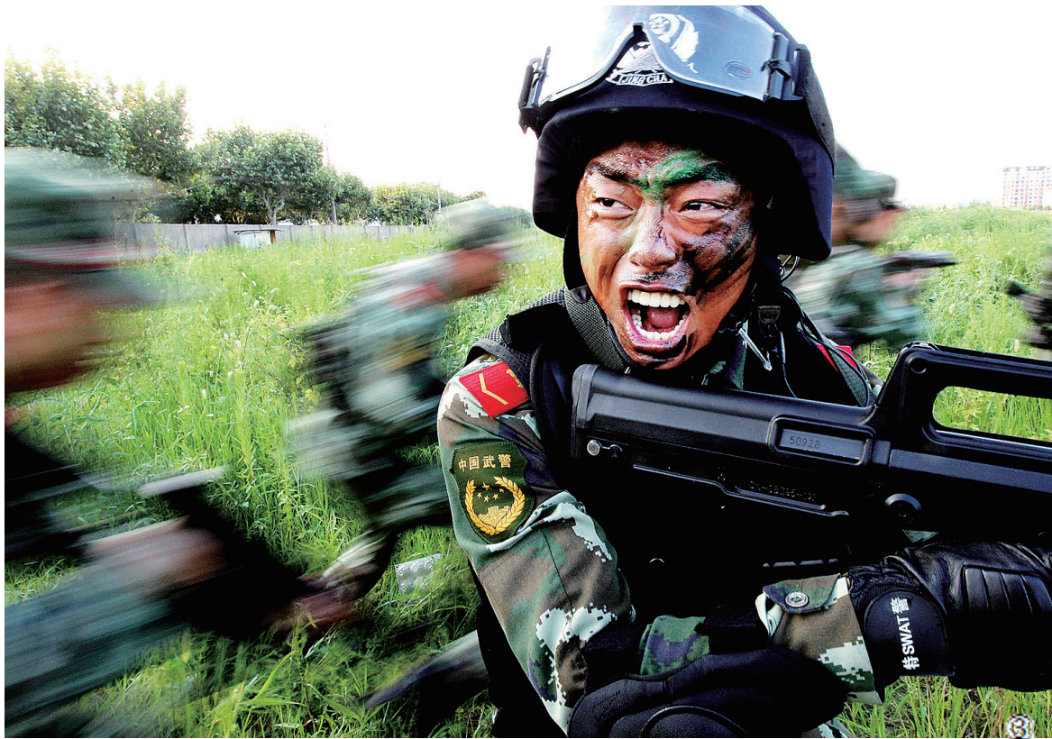
八一前夕,武警上海总队三支队官兵举行“红蓝军”实兵演练对抗。在“蓝军”设置的昼夜行军、翻越沟壑、野战生存、穿插对抗、紧急搜捕等课目考核中,“红军”不断失利,在深刻总结后反败为胜。