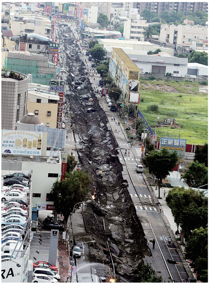
事发街道路面被破坏