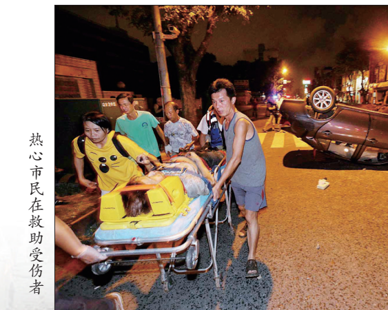
热心市民在救助受伤者