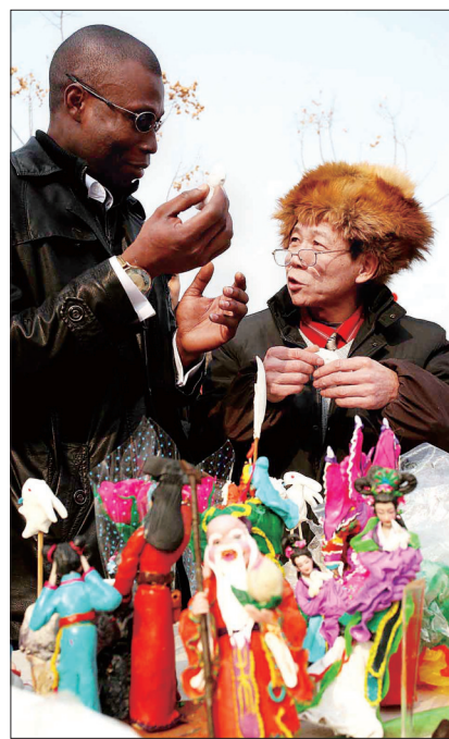
2011年2月,方阔迎春节河洛文化庙会

根在河洛酒 河洛文化旅游节唯一指定接待用酒 团购招商电话:13103796999