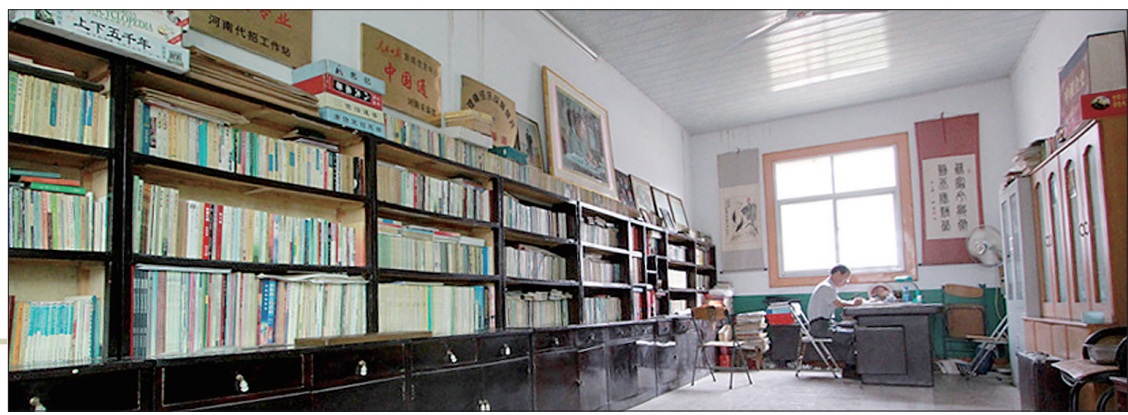
曲少波家的大书房

我们注意到,上述假说的提出以及放弃,都是建立在另外的假说及其变化的基础上的。而包括“二里头夏文化说”在内,诸假说都没有当时的“内证性”文字材料的支持。如前所述,精通古文字和古文献的冯时研究员仍然坚持“陶寺夏文化说”。论辩各方都没有充分的理由彻底否定他方提出的可能性。