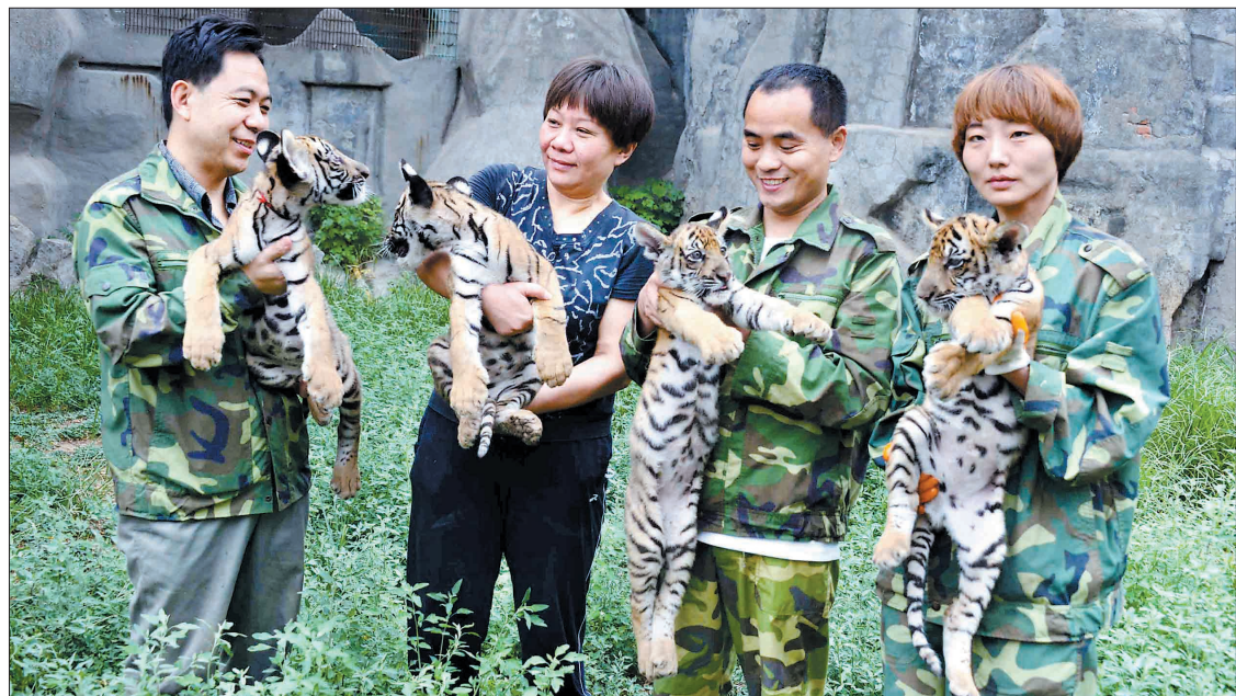
快百天了,拍张“全家福”吧

昨日,王城公园动物园新增的4只华南虎崽,在饲养员的引导下首次走到室外“看世界”。此次人工育幼成活的4只华南虎崽,追平了目前世界上单次人工育幼成活数量的最多纪录。