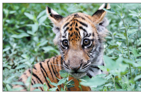
小“百兽之王”,一脸萌样

从下周起,这4只虎崽将正式与广大游客见面。本报记者 赵佳 特约记者 乔丽娜/文