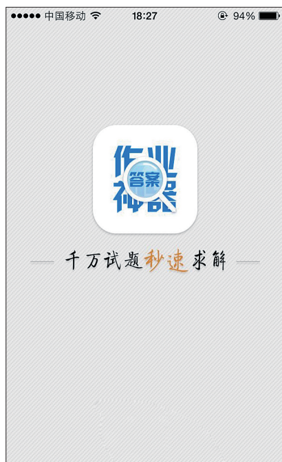
“作业神器”广告语颇具吸引力