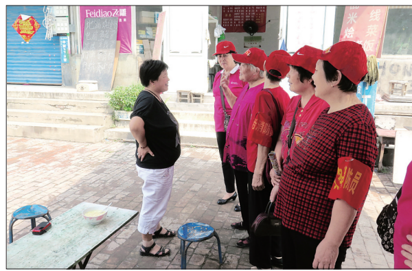
“老妈妈防火团”走街串巷,义务宣传消防安全

几位头戴红帽、臂缠袖章的老太太,在火车站附近来回转悠,看到存在安全隐患的地方,都要“检查检查”。19年来,“老妈妈防火团”走街串巷,义务宣传消防安全。