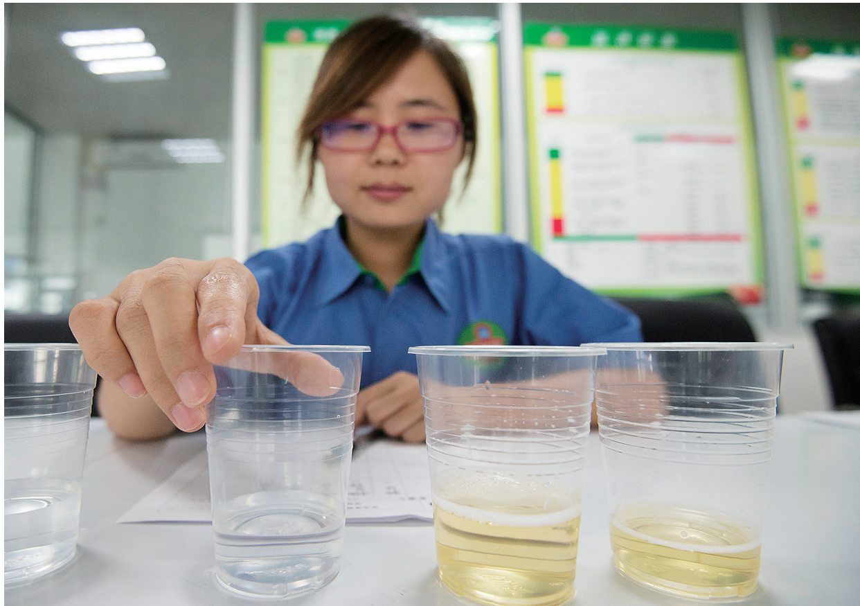
每个环节的样品都需要品尝