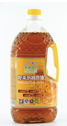
好来历胡麻油 规格:1L/瓶(大约1.8市斤),16瓶/件 洛阳普及价:59元/瓶

郑重承诺 好来历胡麻油、亚麻籽油每一滴都来自亚麻籽,它产自内蒙古阴山山脉的高山沟壑中。如被检测出其中混有其他油品,好来历即刻奉上“原生态食材监督奖”10000元人民币。 好来历·洛阳优质生活必需品保障平台 2014年8月13日