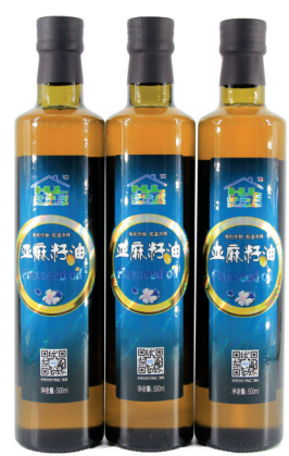
好来历亚麻籽油 规格:500ml/瓶,12瓶/件 洛阳普及价:98元/瓶

单瓶选购请到好来历专卖店,整箱购买好来历负责主城区内送货上门。 咨询电话:洛阳日报报业集团“百姓一线通”0379-66778866 售后服务:0379-63350000 集团客服:18603791777