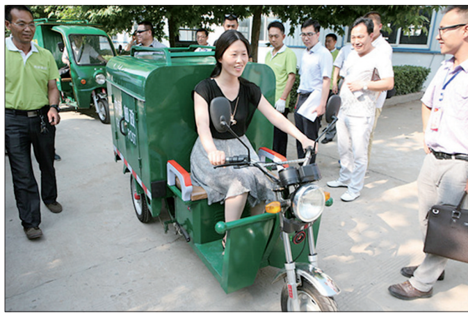
邮政部门推出的“专用电动三轮”(资料图片)

近日,国家邮政局发布《快递专用电动三轮车技术要求》(以下简称《要求》),并将于9月1日正式实施。我市业内人士认为,电动三轮车低碳环保,载货量大,已成为许多快递公司“最后一公里”服务的首选交通工具。《要求》实施后,将大大增加快递交通的安全性、便利性,有利于快递行业规范发展。