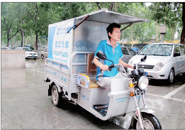
投递人员改装的“快递三轮”