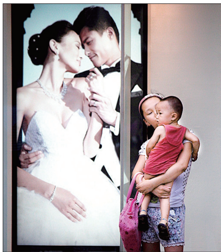
爱的接力