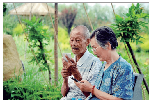
与时俱进 微尘德广 摄

请九都黄龙、微尘德广将个人联系方式发至lyrbshb@163.com,以奉薄酬。