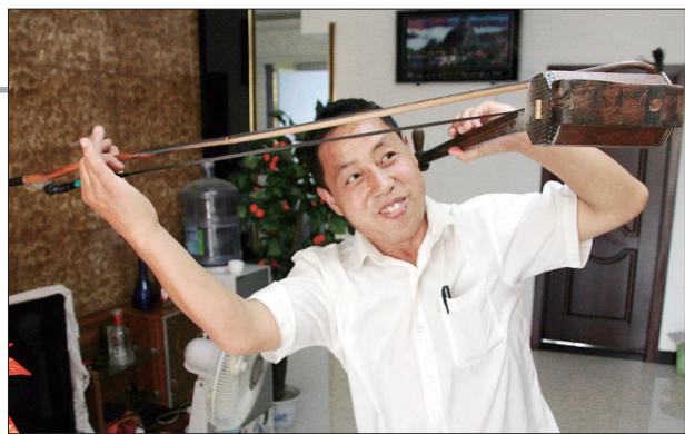
练习板胡悬空演奏绝技