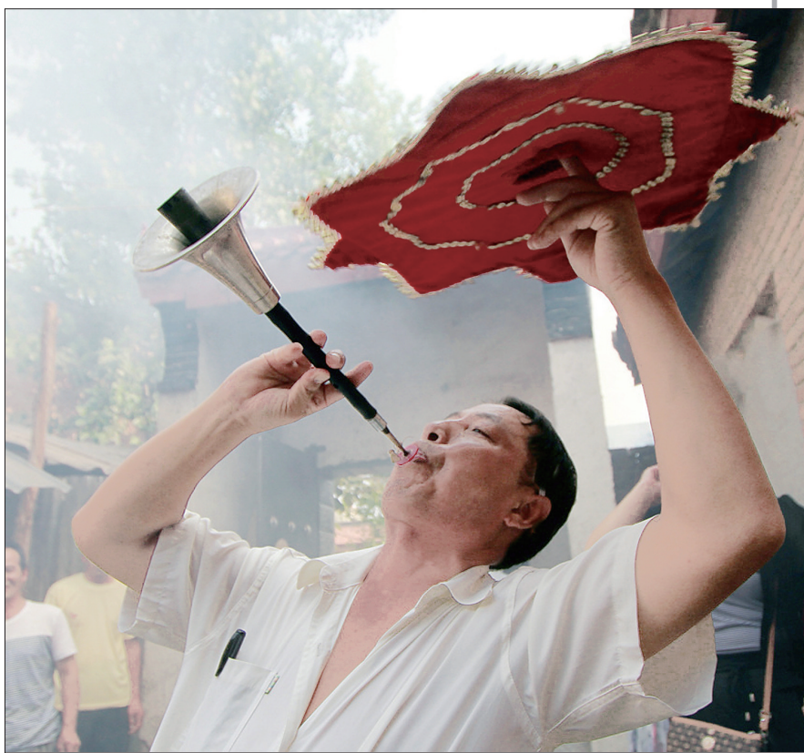
边舞边吹,气度不凡