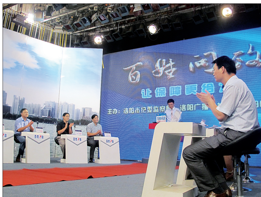
《百姓问政》节目第五场直播现场