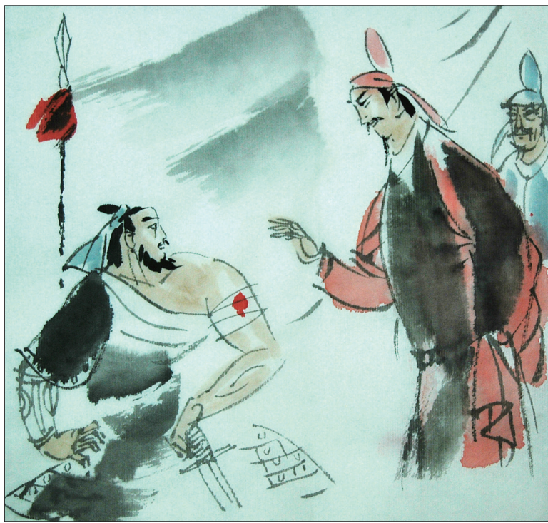
唐太宗慰问负伤的大将军李思摩 插图 李小明