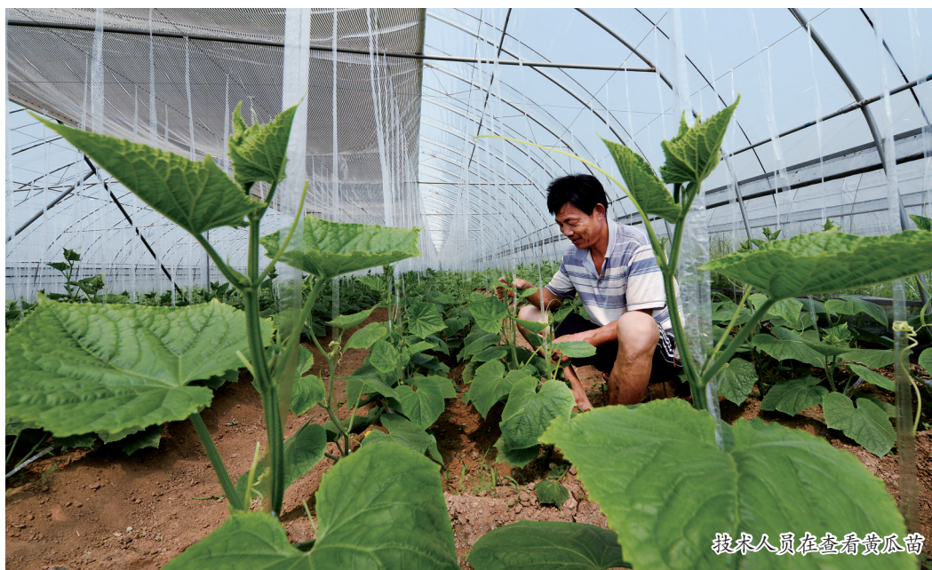
技术人员在查看黄瓜苗