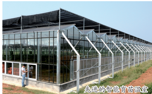
先进的智能育苗温室