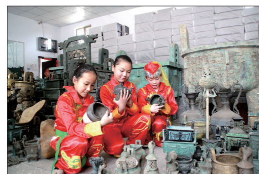
伊川做出的青铜器备受青睐