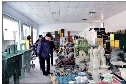
洛阳烟云涧青铜器加工工艺博物馆