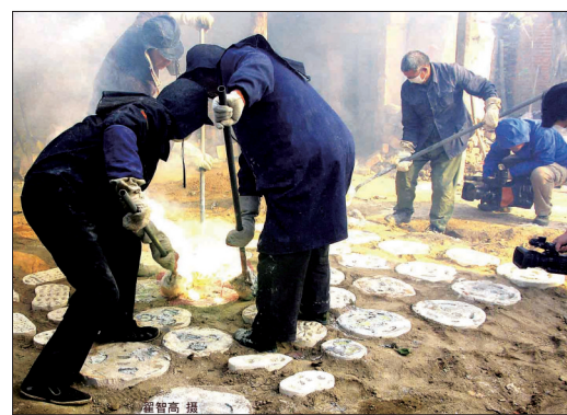
高温铜液浇铸是个辛苦活