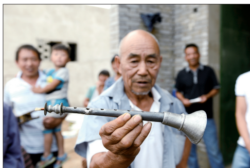
传统音乐《十盘》所用的乐器