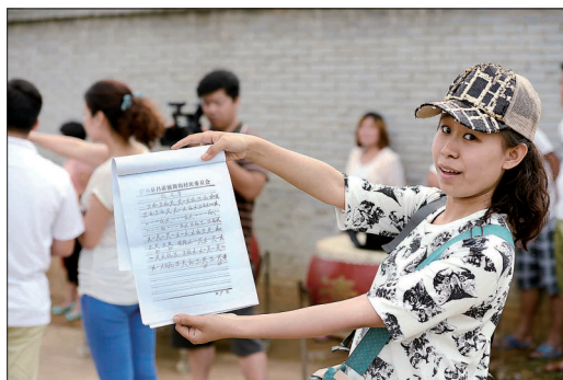
传统音乐《十盘》所用的乐谱非常特殊

全国各地到处都有啊,伊川县的特色是啥?在普查申报成功的50多项名录里,哪一项能够代表伊川最古老的独一无二的民间特色文化?最终,经过认真筛选,选定了民间舞蹈《跑阵》和传统音乐《十盘》。(邵晓静)