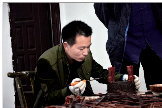
青铜器模具制作——做蜡模