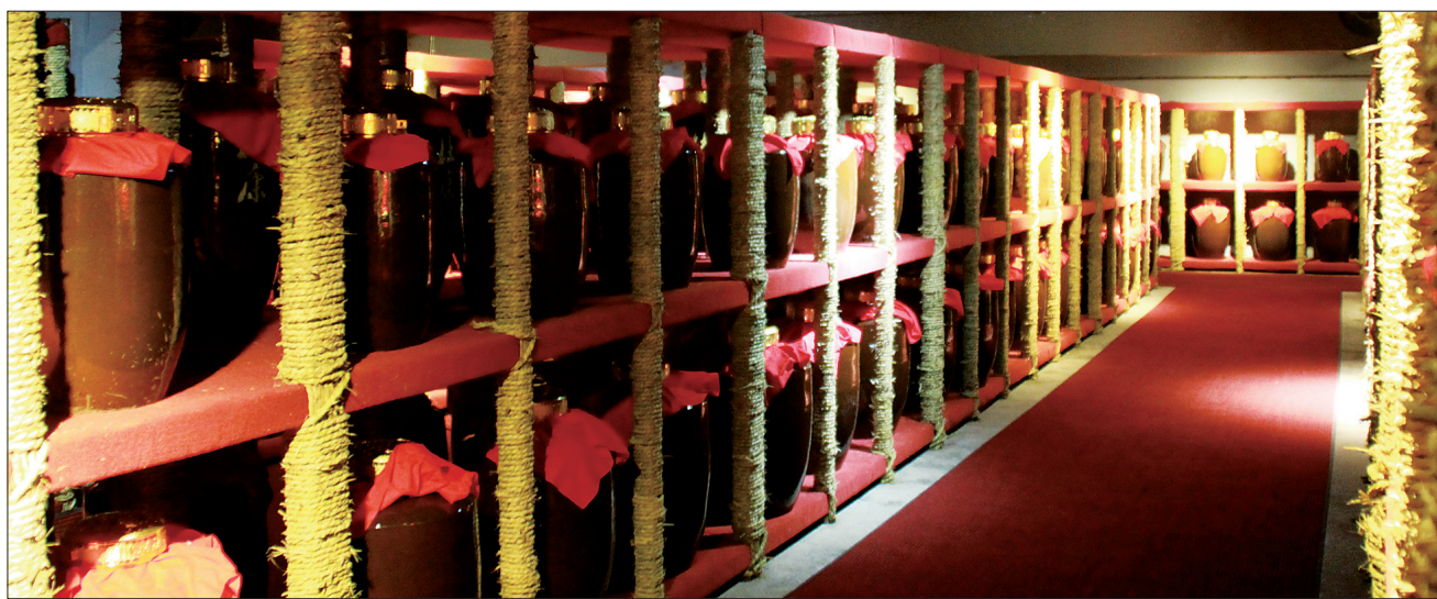
杜康酒厂地下酒窖

近年,伊川文化部门通过搜集整理,挖掘了一批非物质文化遗产项目,目前,该县有省级项目名录2项,市级项目名录6项。其中,杜康酿酒工艺和青铜器制作工艺等2项已分别申报为省级非遗项目;民间文学《程门立雪》《邵夫子传说》,传统医药《偏瘫速愈康制备工艺》《易筋经导引术》,民间舞蹈《跑阵》,传统音乐《十盘》等6项已申报为市级非遗项目;县文化部门还收录50多项县级非遗项目。