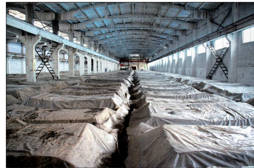
杜康酒传统酿酒池