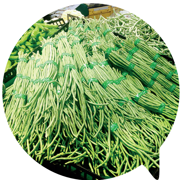
被胶带捆扎整齐的蔬菜

经常去超市买菜的市民,一定对“缠菜胶带”不陌生。在超市的蔬菜货架上,经常能看到长豆角、芹菜等被胶带捆扎得整整齐齐。胶带能与蔬菜直接接触吗?是否对人体存在潜在危害?