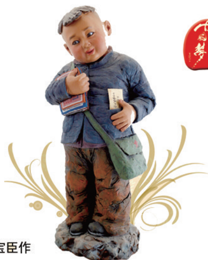
泥人张彩塑王宝臣作