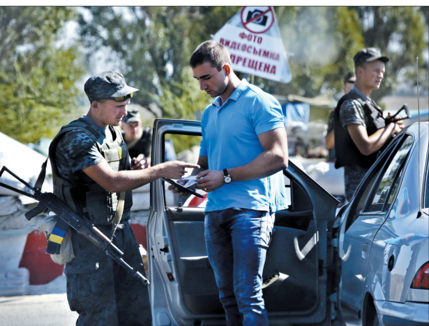
26日,在乌克兰东部马里乌波尔市的一个检查点,乌克兰士兵检查一辆汽车

乌克兰国家安全部前一天说,10名俄军伞兵当天在乌克兰东部边境地区被俘获。他们隶属俄罗斯第98伞兵师331团,在乌克兰顿涅茨克市附近被俘获。