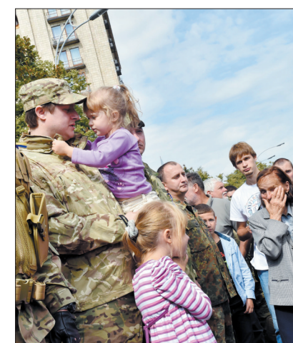
8月26日,在乌克兰基辅,人们参加锡奇特别志愿军的宣誓和告别仪式。他们将前往乌克兰东部打击民间武装

乌克兰国家安全部前一天说,10名俄军伞兵当天在乌克兰东部边境地区被俘获。他们隶属俄罗斯第98伞兵师331团,在乌克兰顿涅茨克市附近被俘获。