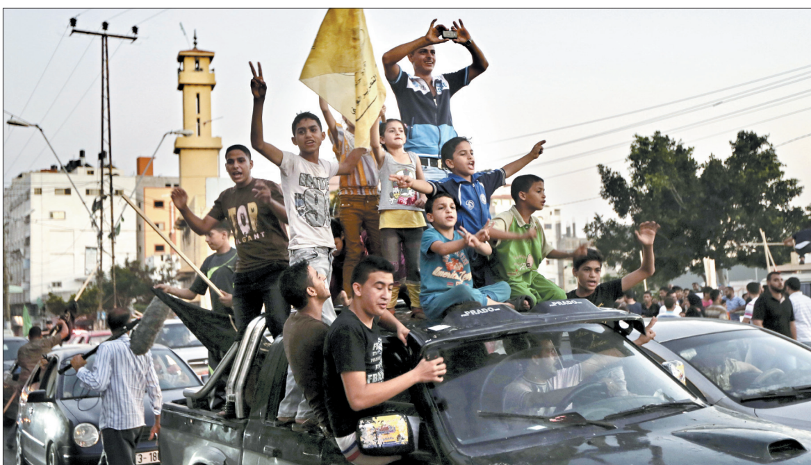
26日,巴勒斯坦人在加沙城街头庆祝加沙地带实现停火

据新华社北京8月27日电 在埃及方面的斡旋下,巴勒斯坦和以色列26日达成停火协议,停火于当地时间19时(北京时间27日0时)开始生效。 以色列总理发言人马克·雷格夫26日晚发表声明说,以色列已接受埃及提出的停火提议。他同时表示,只有在加沙地带的“恐怖袭击”完全停止后,以色列才会就加沙地带的未来与巴方进行间接会谈。 巴勒斯坦国总统阿巴斯26日晚宣布,由埃及斡旋的巴以双方停火谈判达成一致,加沙地带长期停火于当地时间19时正式生效。 在通过巴勒斯坦官方电视台发布的简短声明中,阿巴斯说:“我宣布,巴勒斯坦领导层接受埃及提出的全面永久停火提议,我们接下来将为实现加沙人民的愿望和需求继续努力。”