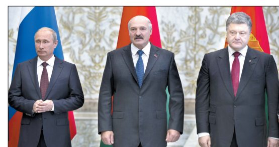
26日,在白俄罗斯首都明斯克,俄罗斯总统普京(左)、白俄罗斯总统卢卡申科(中)、乌克兰总统波罗申科在会谈前合影

俄罗斯总统弗拉基米尔·普京与乌克兰总统彼得罗·波罗申科26日在白俄罗斯首都明斯克举行双边会晤,历时大约两小时,讨论乌克兰局势。 会晤在当天举行的俄白关税同盟成员国、欧洲联盟、乌克兰三方磋商结束后进行。这是波罗申科今年6月初就任乌克兰总统以来,两国领导人首次正式会晤。此前普京与波罗申科在法国短暂会面。 波罗申科27日凌晨在新闻发布会上说,这次对话“非常艰难和复杂”,“必须以双边形式”尽快达成一项停火机制,为此,需要制定一份路线图。 普京则说,他与波罗申科没有讨论停火方案细节,俄罗斯也不应参与制定细节,详细方案需要由乌克兰政府和民间武装达成。“这不是我们的事。”他说,“这是乌克兰自己的事……我们只能帮助创造互信氛围,以便开启极为必要的谈判。” 乌克兰当局25日说,俘获10名非法进入乌克兰的俄罗斯伞兵。乌方还在网站上发布视频,展示“战俘”。俄罗斯媒体援引一名俄罗斯国防部官员的话报道,确有俄伞兵在边境地区巡逻时“误入”乌克兰被对方拘留。 针对乌方的说法,普京说,他还没有收到俄军方报告,“但是就我所知,他们当时正在边境巡逻,可能不知不觉进入了乌克兰”。 (新华社8月27日特稿)