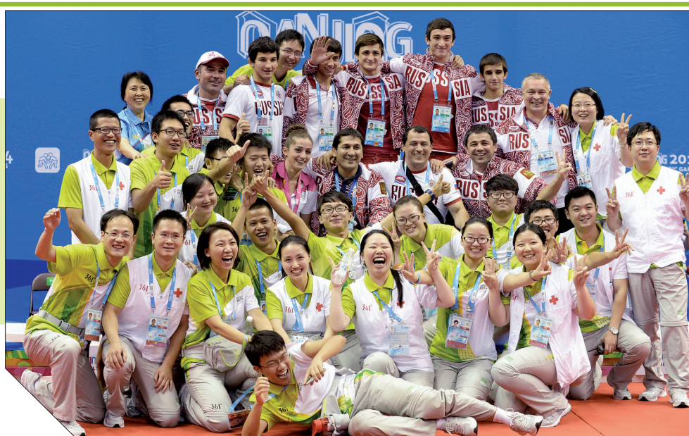
志愿者与运动员合影留念

第二届夏季青年奥林匹克运动会于8月28日在这里闭幕。在开幕后的12天里,来自世界各地的3700多名青年运动员在28个大项222个小项的比赛中收获成绩,得到历练;在各项文化教育活动中增进了解,加深友谊,书写出充满青春与梦想的奥林匹克新篇章。