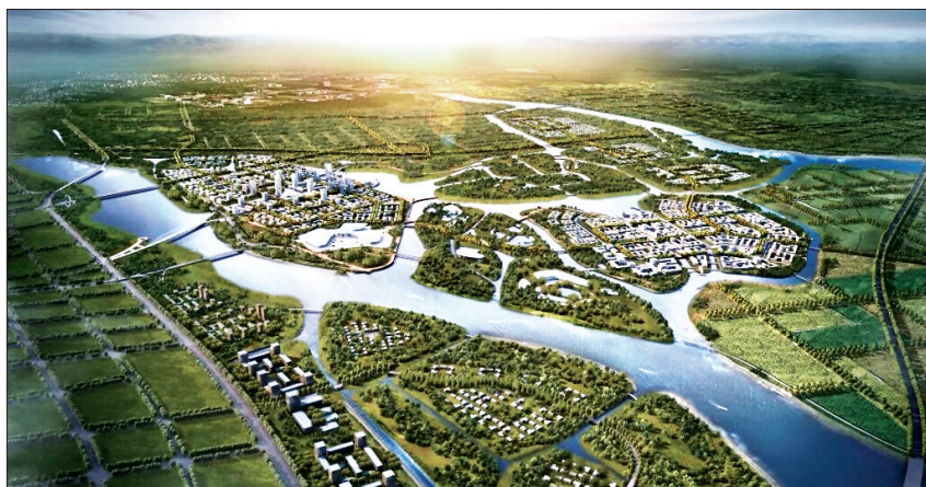
项目效果图(资料图片)

您能否想到,若干年后,一座明日水城将在这里拔地而起。这,就是正在建设的伊洛河水生态文明示范区。