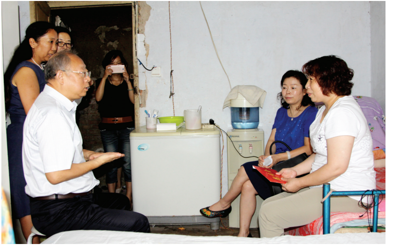
市总工会党组书记、常务副主席张冀昌入户进行“金秋助学”活动走访