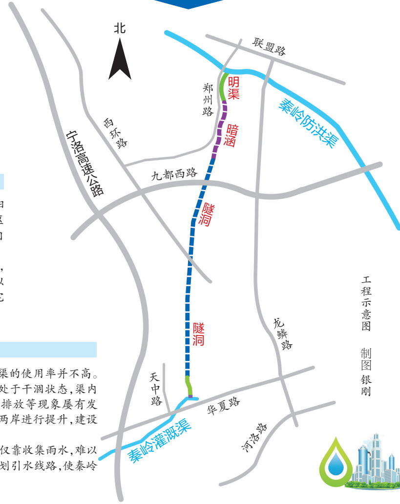
工程示意图 制图:银刚

“秦岭灌溉渠与秦岭防洪渠并非同一水利工程。”市水务局工程管理科负责人说,秦岭灌溉渠的主要功能定位是灌溉。该渠始建于1920年,渠首位于宜阳县城洛河北岸,引洛河水至宜阳县、高新区、涧西区等,自流灌溉沿线2万余亩耕地,渠长29.8公里。如今,秦岭灌溉渠涧西区段已基本不存在。由于补给秦岭防洪渠的秦岭灌溉渠水源来自洛河,工程故名“引洛济秦”。