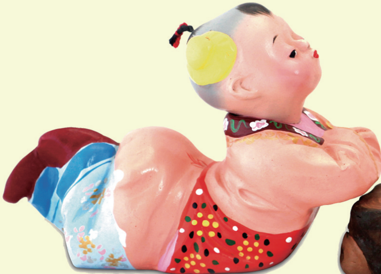
泥人张彩塑 王润荣作