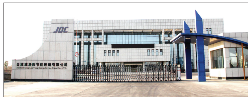
金堆城洛阳节能玻璃有限公司