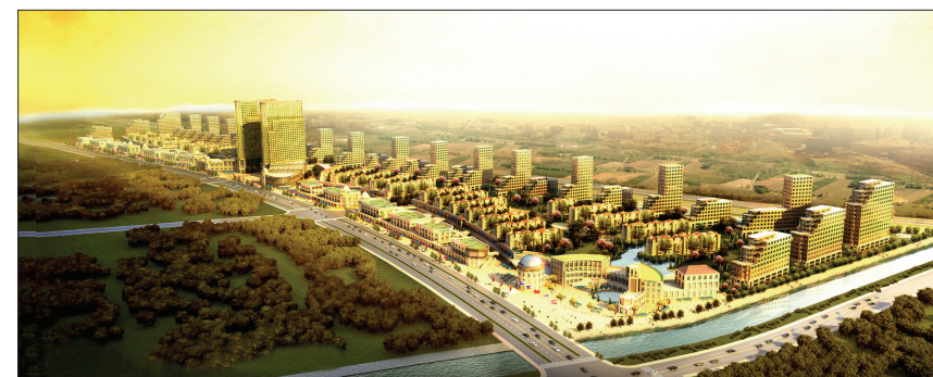
综合服务区效果图