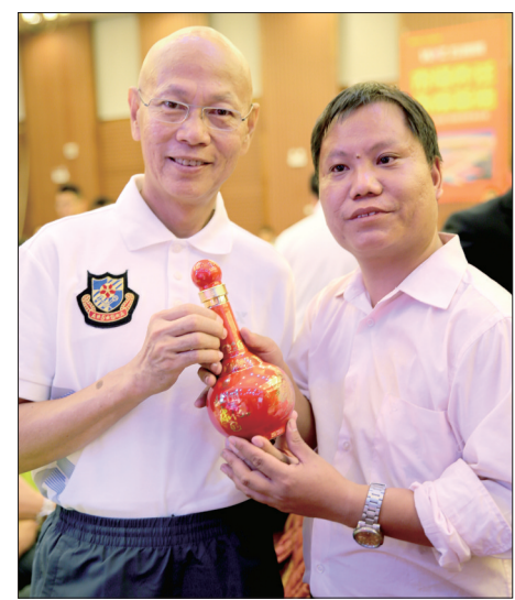
杜康企业代表赠送香港明星罗家英“国花杜康15年”美酒