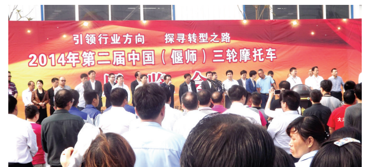
2014年第二届中国(偃师)三轮摩托车展览会开幕式

按照“延链、补链、建链”的工作思路,该区认真做好招商工作,着力引进与三大主导产业关联度大的大项目、好项目,加快推进产业转型升级。三轮摩托车产业,相继引进丰铨电动车、珠峰电动车、大阳电动车、凯重工混凝土罐车、重庆鑫源小型农机、世强汽配、无锡向东高铁配件、东风新能源汽车等一大批转型升级项目,三轮摩托车产业正在由燃油车向电动车、三轮车向四轮车、普通车向特种车、摩配向汽配四个方向转型。新能源产业,着力在