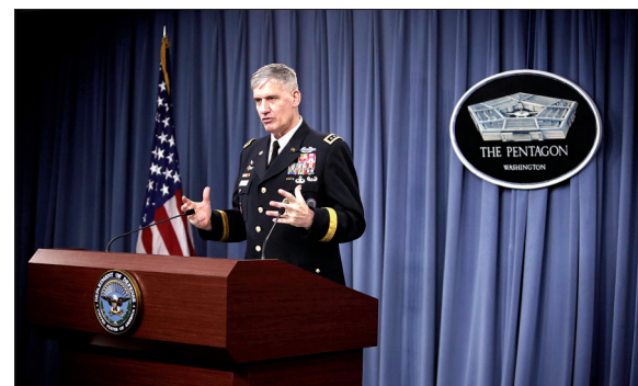
美军继续援助西非抗击埃博拉疫情

在集体自卫权问题上,这份报告说,在日本关系密切国遭到武力攻击的情况下,新指针将根据日本政府7月1日的内阁决议内容,在日本允许行使武力的状况中详细规定日美合作内容。但当地媒体指出,鉴于日本政府暂时推迟向国会提出审议配合行使集体自卫权的相关法案,这份报告未能具体列出日本自卫队行使集体自卫权的场合及方式,预计这部分内容将在今年年底或明年年初公布的最终报告中得到体现。