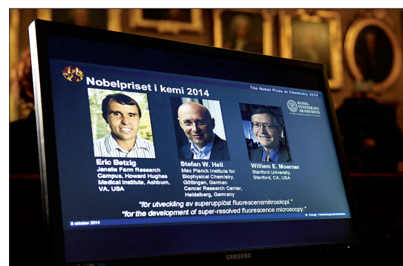
10月8日,在瑞典斯德哥尔摩,电子屏显示出获得2014年诺贝尔化学奖的美国科学家埃里克·贝齐格(左)、威廉·莫纳(右)和德国科学家斯特凡·黑尔的信息。

新华社斯德哥尔摩10月8日电(记者 和苗 付一鸣)瑞典皇家科学院8日宣布,将2014年诺贝尔化学奖授予美国科学家埃里克·贝齐格、威廉·莫纳和德国科学家斯特凡·黑尔,以表彰他们为发展超分辨率荧光显微镜所做的贡献。