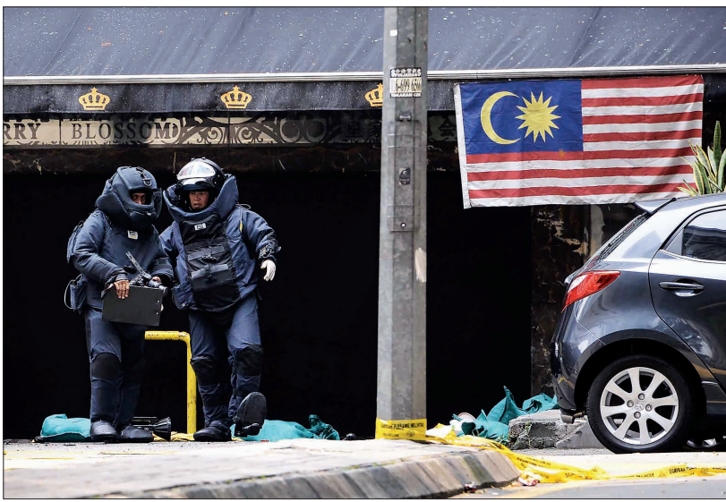
9日,在马来西亚首都吉隆坡,马来西亚警方在爆炸现场调查

当地媒体报道,警方4时30分左右接到报警:武吉免登一家酒吧外发生爆炸。武吉免登意为“星光大道”,是吉隆坡热门商业餐饮区,道路两旁坐落着众多酒吧、夜总会等娱乐场所,是当地人和游客夜生活的好去处。爆炸导致14人受伤,其中1名男性稍后在医院伤重不治。警方说,这名死者是停车场管理员,马来西亚人。吉隆坡警方副主管哈里·阿萨说,伤员包括多名马来西亚人、中国人和1名泰国人、1名新加坡人。