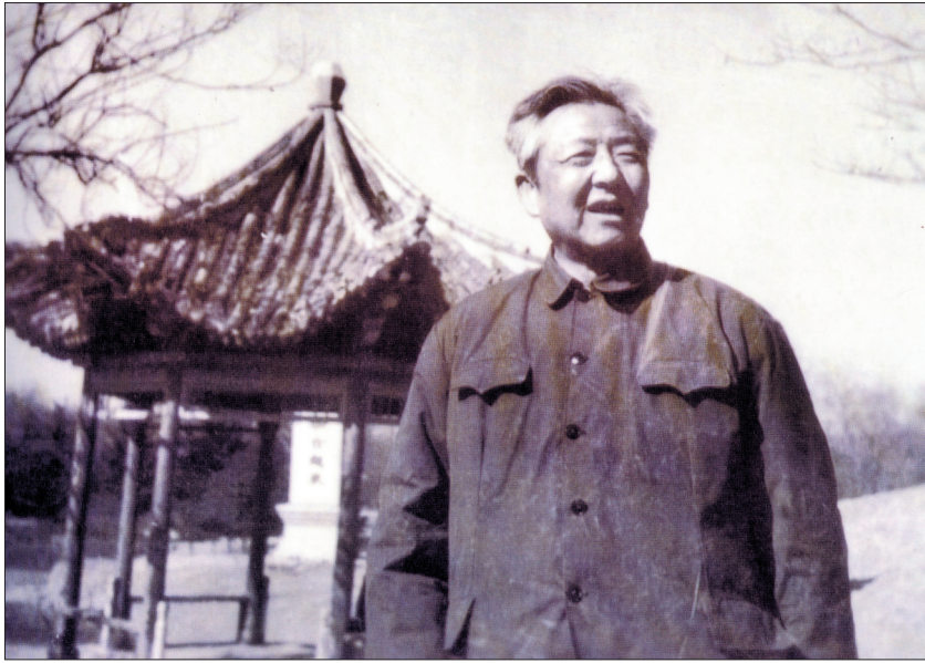
1975年习仲勋在洛阳 (资料图片)

从1975年5月至1978年2月,习仲勋在洛阳耐火材料厂(中钢集团耐火材料有限公司前身)生活了近3年,给洛耐人留下了难以忘怀的深刻印象:虽然身处逆境蒙受冤屈,但他对共产主义的坚定信念不移,对党和革命事业的忠诚不变,“党的利益放在第一位”(毛泽东同志给习仲勋同志的题词);虽然遭受错误审查,暂时离开了工作岗位,不再担任任何职务,但他襟怀坦荡、豁达乐观,逆境未敢忘忧国;他“住闲”不“闲住”,“轻闲”不“清闲”,和职工群众交朋友,用心倾听群众呼声,仔细了