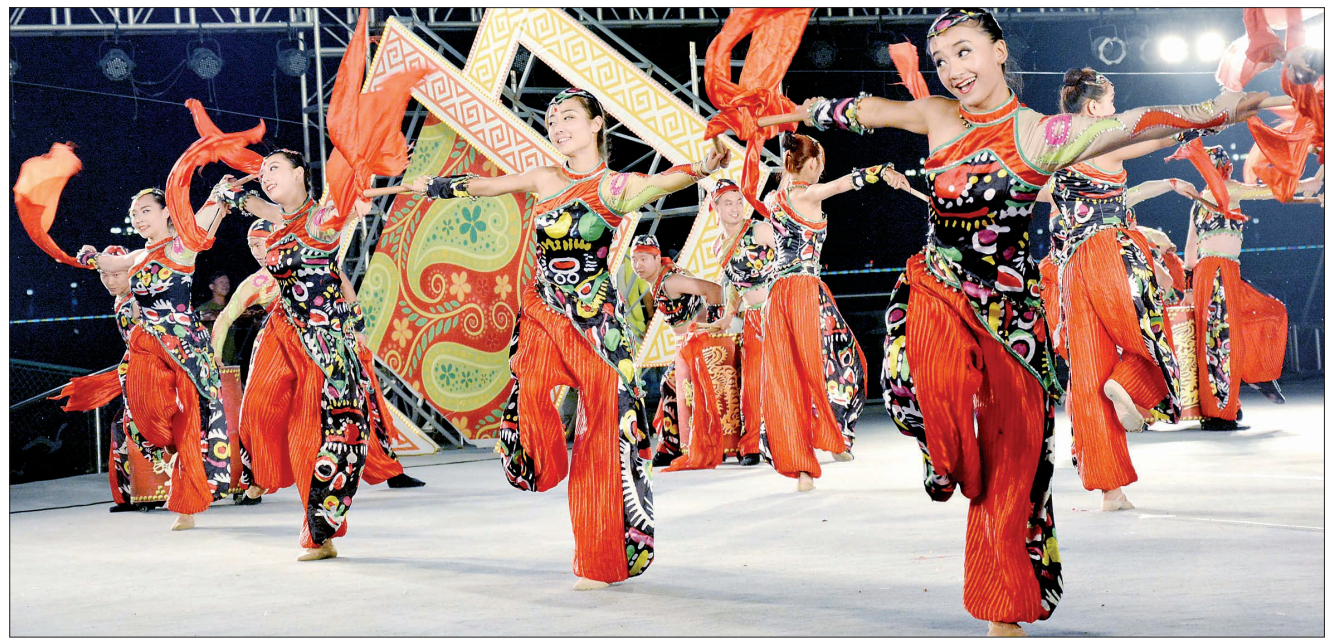
百姓的舞台(资料图片)

样丰富多彩……这是宜阳县加强公共文化服务体系建设、落实文化惠民的一个生动缩影。近年,该县按照“政府主导、城乡统筹、整合资源、整体提升”的工作思路,以开展“基层公共文化服务提升”活动为抓手,以提升群众文化幸福指数为目标,不断夯实基础,营造软环境,积极开展形式多样的文化活动,丰富广大群众的文化生活。