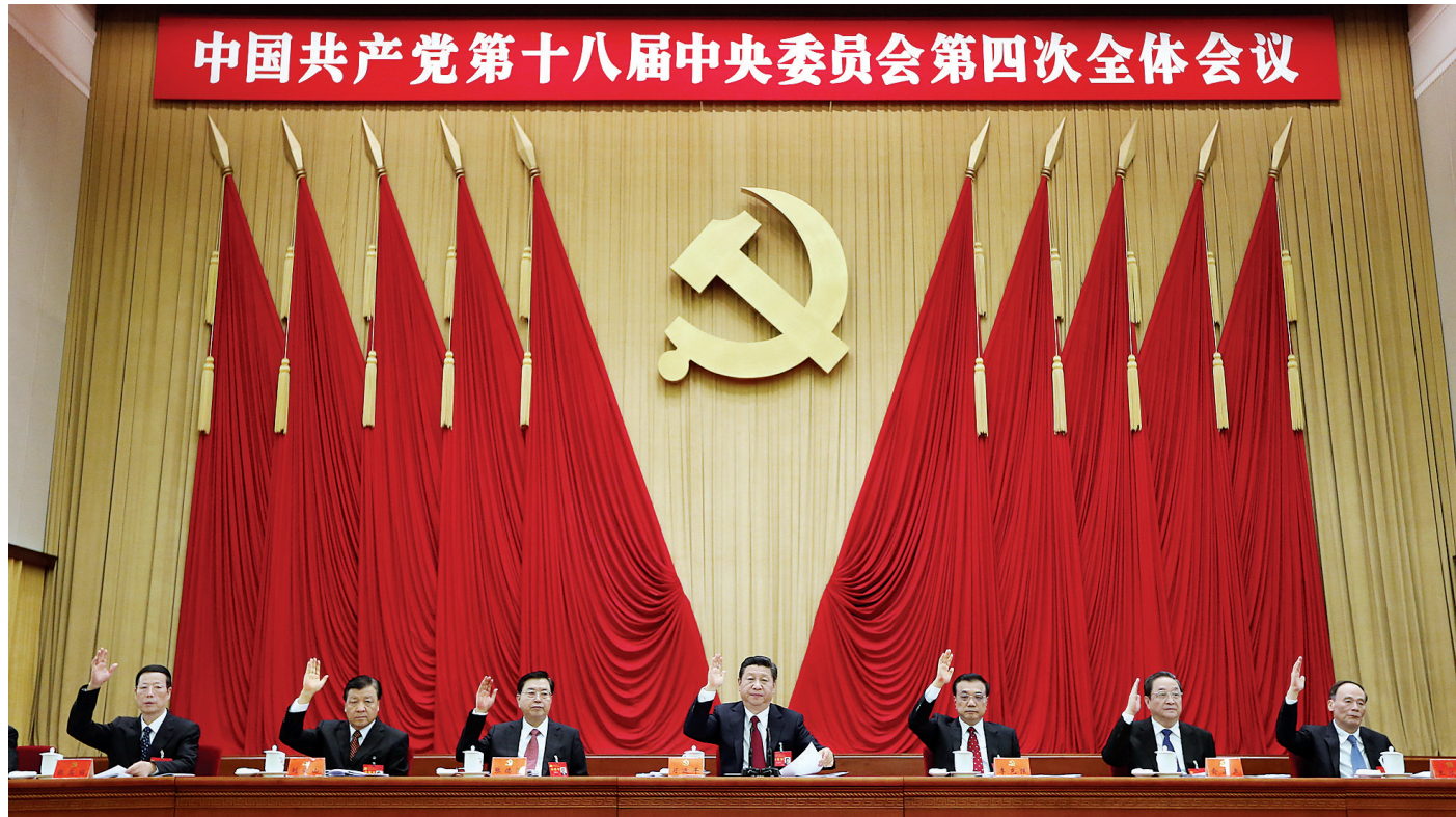
中国共产党第十八届中央委员会第四次全体会议,于2014年10月20日至23日在北京举行。这是习近平、李克强、张德江、俞正声、刘云山、王岐山、张高丽在主席台上

新华社北京10月23日电 中国共产党第十八届中央委员会第四次全体会议公报(2014年10月23日中国共产党第十八届中央委员会第四次全体会议通过)