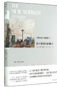
★作者:安·比蒂 ★出版社:译林出版社