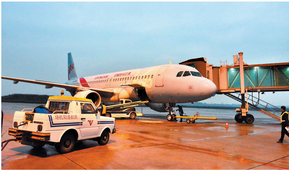
昨日17时35分,浙江长龙航空有限公司航班降落洛阳机场,我市至兰州新开通航线首航成功

洛阳飞往兰州 航班号为GJ8763, 17:35从洛阳机场起飞,19:15到达兰州; 兰州飞往洛阳 航班号为GJ8764, 20:00从兰州起飞,21:10到达洛阳机场。该航班单程全价机票为1110元(不含税费)。