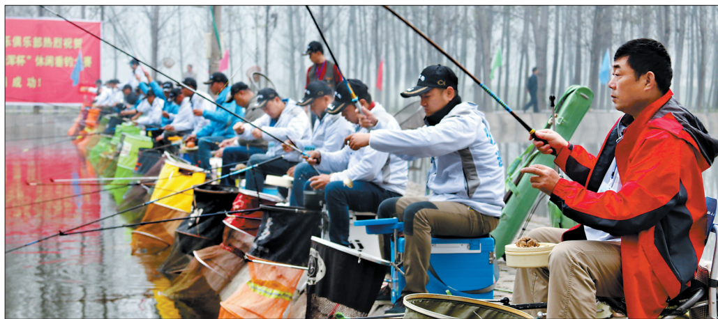
省首届休闲垂钓大赛现场

近日,省首届休闲垂钓大赛在陆浑水库国家级休闲渔业示范基地举办,吸引了不少垂钓爱好者关注。近两年,我市休闲渔业发展红火,形成多个“叫得响”的休闲渔业基地,与此同时,缺乏统一规划及保护,产业发展“小而散”等“成长的烦恼”也日渐凸显出来。