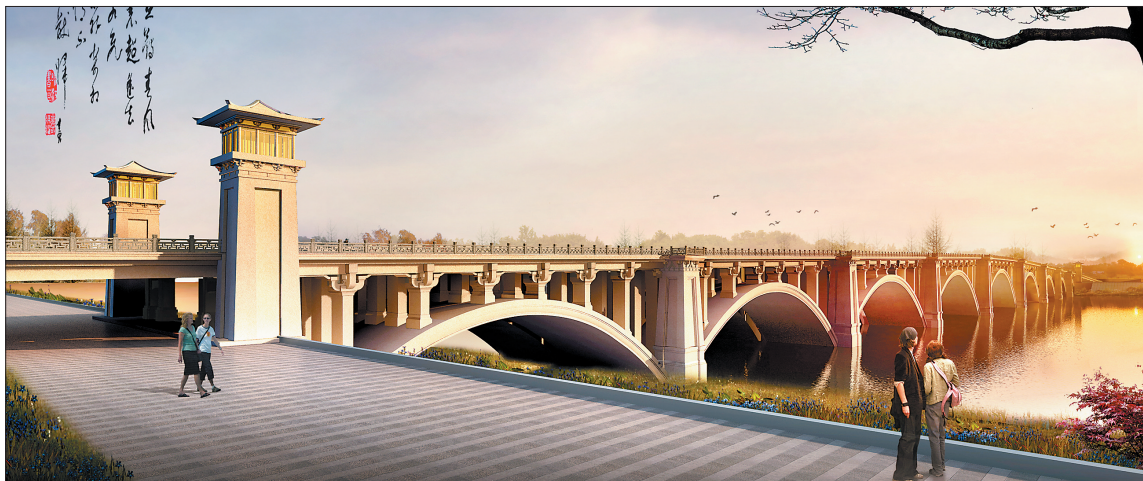
新街跨洛河大桥效果图