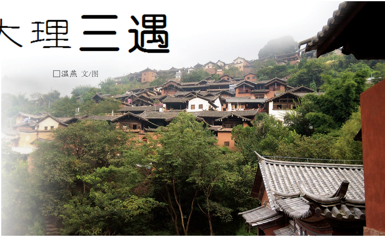
层层叠叠的诺邓民居