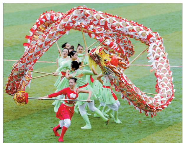
全民健身·首届贵州忠县全国舞龙邀请赛开赛