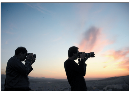
摄影爱好者的好去处