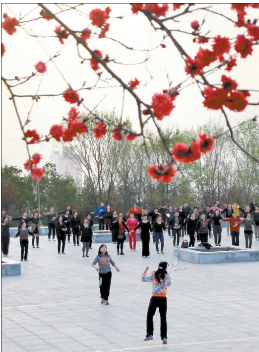
这里如今已成百姓乐园