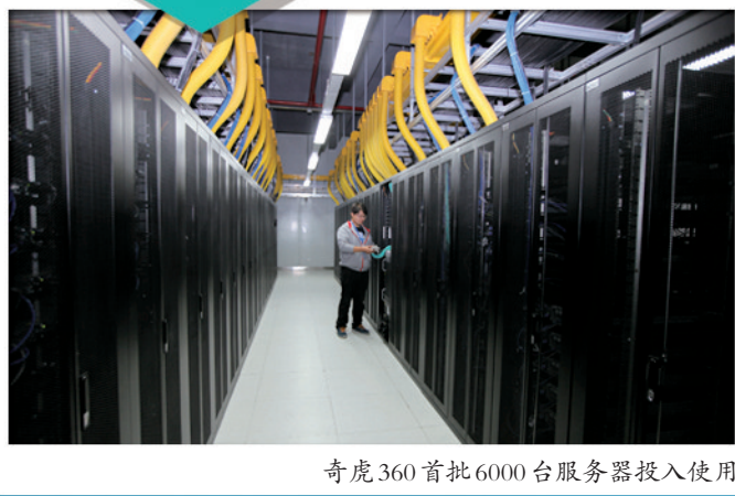
奇虎360首批6000台服务器投入使用