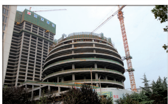
恒河国际会展中心建设快速推进