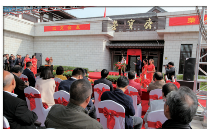
百年名店——荣宝斋洛阳店盛大开业