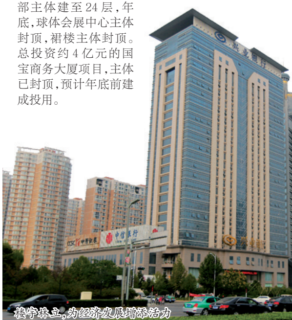
楼宇林立,为经济发展增添活力