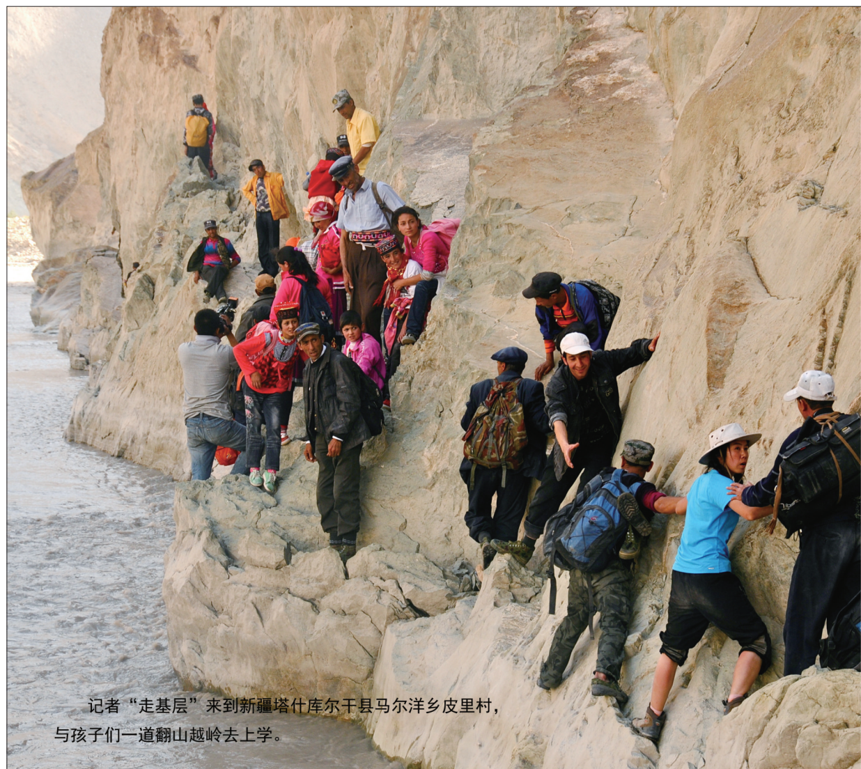
记者“走基层”来到新疆喀什库车县马尔洋乡皮里村,与孩子们一道翻山越岭去上学。